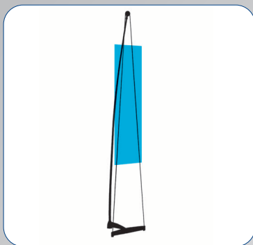
ChronoExpo 2 Staffelei